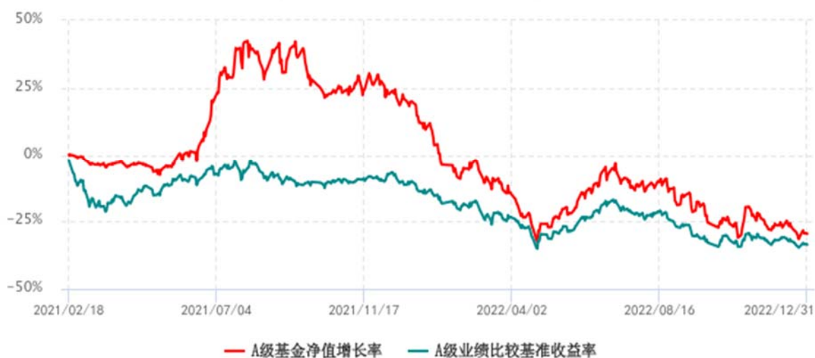
A级基金份额累计净值增长率与同期业绩比较基准收益率历史走势对比图 (2021年02月18日-2022年12月31日)